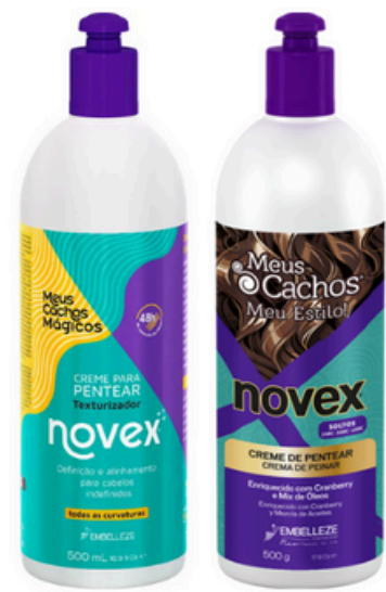
Diferente presentación mismo contenido

Meus Cachos Soltos Crema de Peinar permite que los rizos permanezcan profundamente hidratados, suaves, sueltos y con un brillo radiante. Contiene la fórmula de arándano, una poderosa fruta que tiene el efecto sorprendente Memorizador y protección solar al pelo. Ideal para te uras 2ABC-3ABC-4ABC